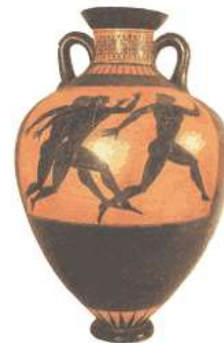
Изображение бегунов на амфоре. Эллада. VI в. до н.э.