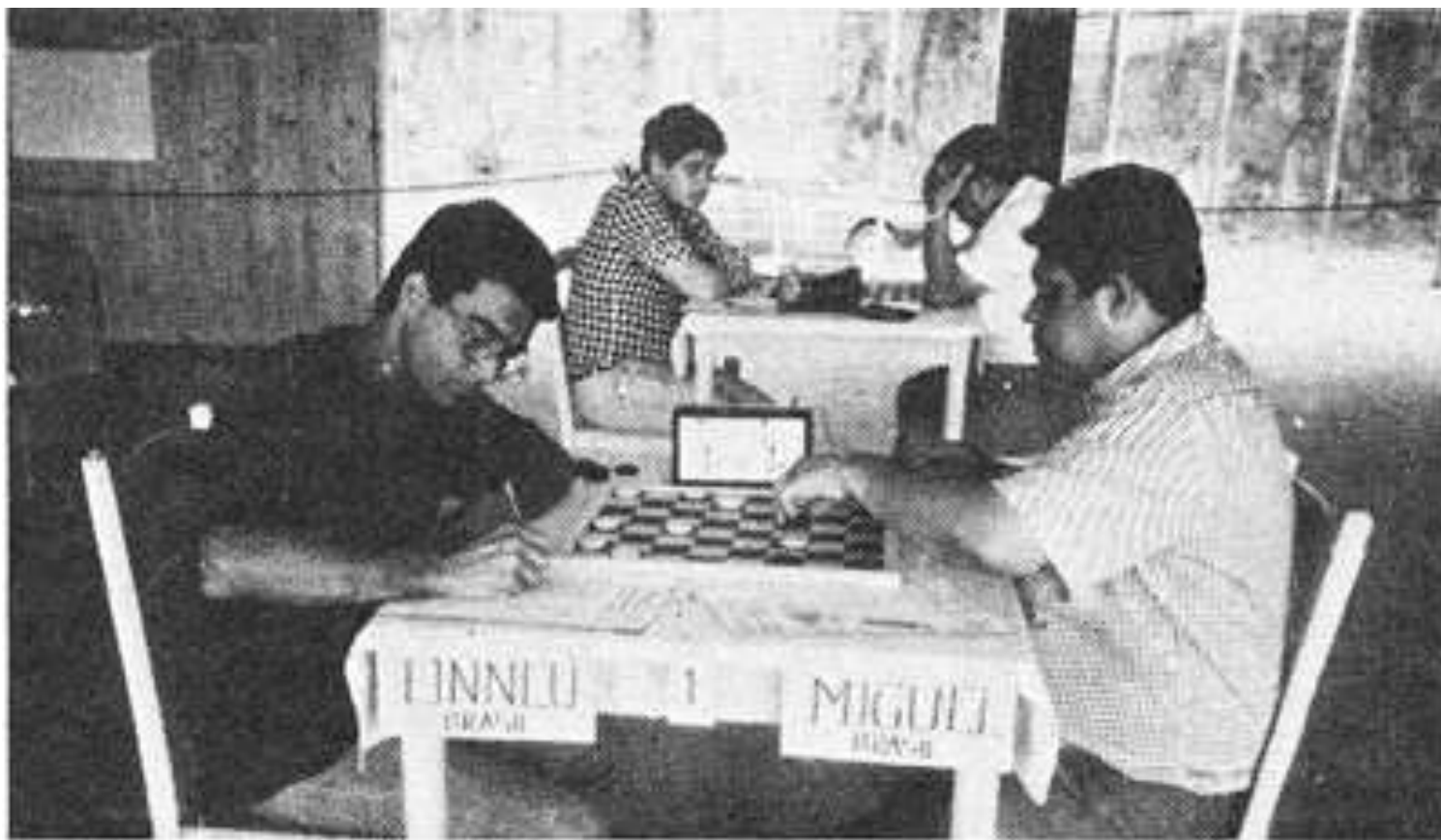
Л. МОНТЕИРО — М. КАВАЛКАНТЕ.

Популярность шашек росла, и, в Италии, в 1985 г. был организован первый международный чемпионат.